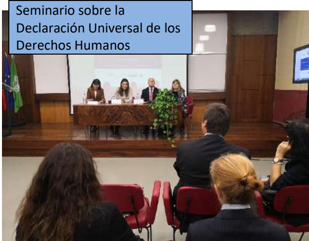
Seminario sobre la Declaración Universal de los Derechos Humanos