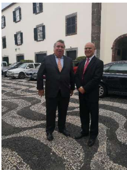
Foto durante la visita institucional en la Sede del delegado del Gobierno de Portugal en Madeira

Durante la mañana del 7 de noviembre de 2018, los socios del proyecto DEMOS, acudieron a una visita institucional organizada por los anfitriones de Senegal. En esta ocasión, tuvieron la oportunidad de reunirse con el Delegado de Gobierno de Portugal en Madeira y, posteriormente, con el Defensor del Pueblo de Madeira.