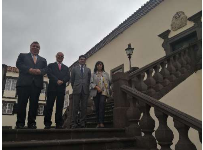
Visita al Defensor del Pueblo en Madeira